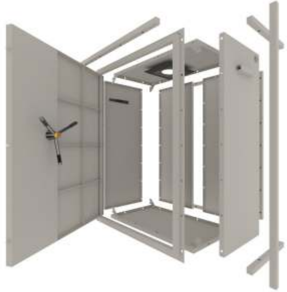
1.4 Yaşam Koruma Kabini (Sığınak)