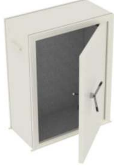
1.2 Yaşam Koruma Kabini (Sığınak)