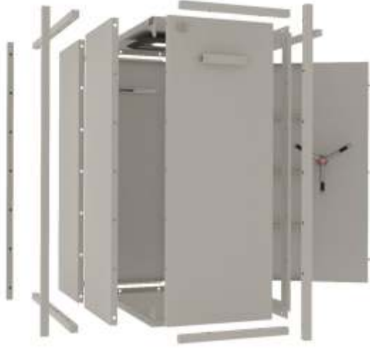
1.5 Yaşam Koruma Kabini (Sığınak)