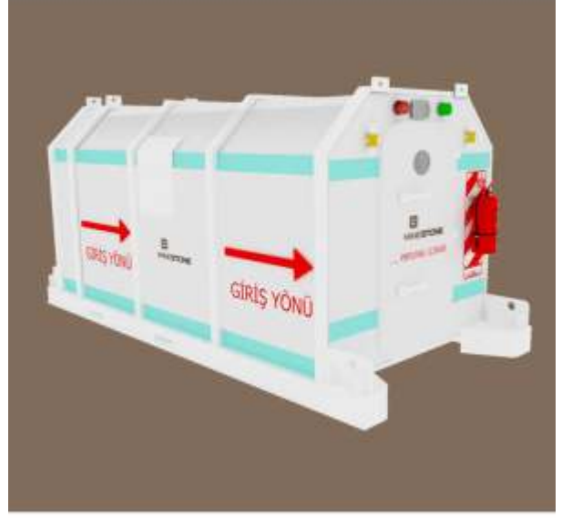
2.1 Yaşam Koruma Kabini (Sığınak)