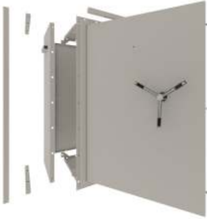
1.3 Yaşam Koruma Kabini (Sığınak)