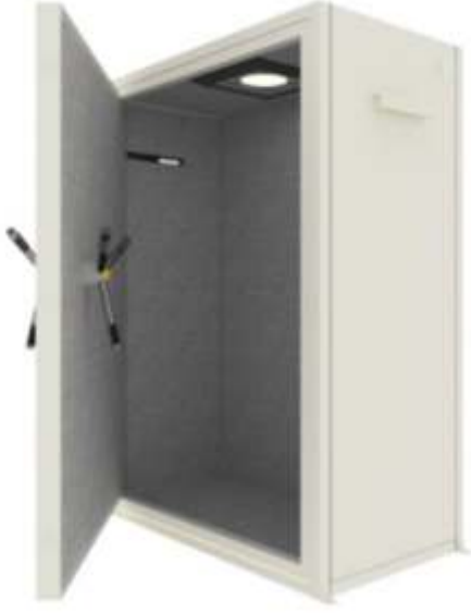
1.1 Yaşam Koruma Kabini (Sığınak)