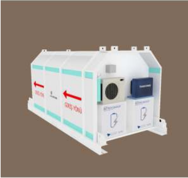
2.2 Yaşam Koruma Kabini (Sığınak)