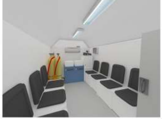
1.2 İç Mekan Yerleşimi