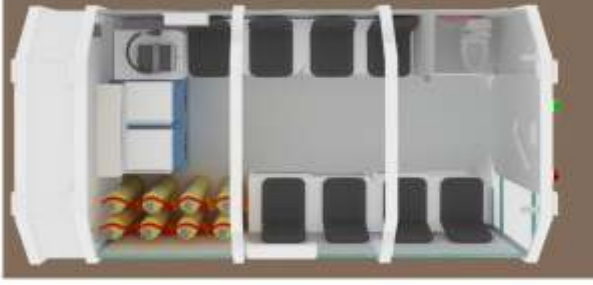
1.1 İç Mekan Yerleşimi