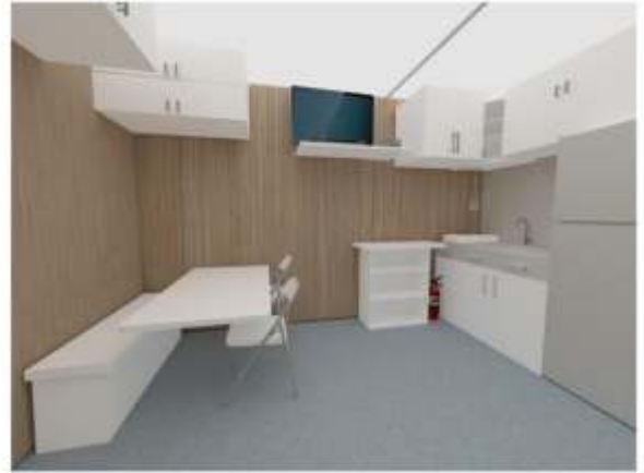
3.1 İç Mekan Yerleşimi